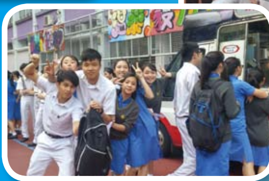
當天反應熱烈，共銷售了三百多杯雪糕