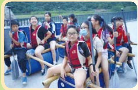
同學們紮好竹筏，準備出發!!

OLE DAY相信係中一同學十分期待的大日子，有機會同一眾同學共度兩日一夜!!除此之外，更加有機會參加刺激好玩的活動，如紮竹筏以及遠足等，令同學更了解自己、更了解同學。不少同學都是第一次參加類似的活動，相信同學都享受過程並有所得著!!