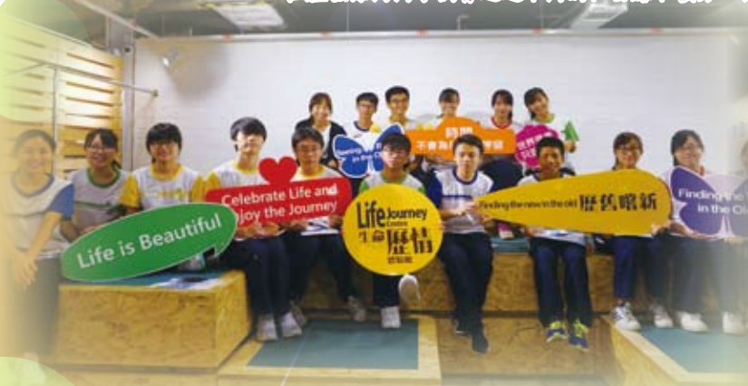
同學們完成活動後都有不同的體會，明白到人生的不可預測，要珍惜時間及身邊的朋友親人。