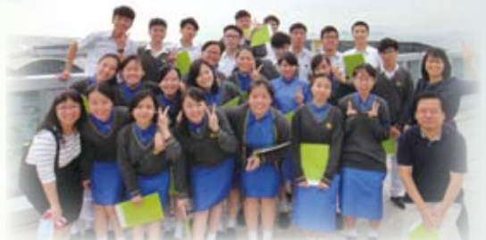
同學在機場大樓天台看完飛機升降後合照