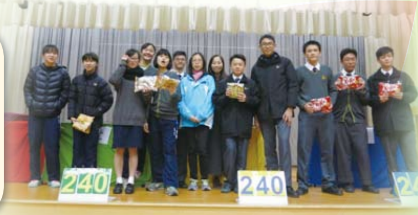
最後4班同學勢均力敵! 齊齊取勝!