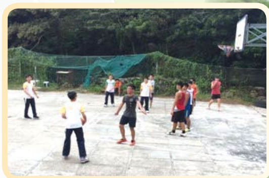
同學除探訪外，亦與正生學生一起打籃球，互相交流！（正生的學生真的很強壯！）

一班學生到長洲正生書院探村，了解村中學生的生活情況及互相交流。在過程中我們看到正生學生的努力和堅持，更看到他們的決心。他們在正生接受嚴苛的生活，同時不斷學習新技能，接受不同程度的體能訓練，運動挑戰，令人對他們另眼相看。