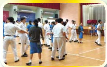
同學當天踴躍投票

學生會選舉已於2016年9月26日順利完成，投票人數有589票，全校投票率達76%，各級投票詳情可參閱下表。點票工作於9月27日完成，APEX得票有88票，ARK得票有458票，廢票有43票，ARK當選為2016-17年度學生會。學生會就職禮亦於9月29日順利完成，接任新一屆學生會。