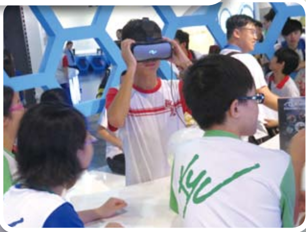
學生正虛擬實景中

我今天參觀了深圳比亞迪公司及工廠、深圳工業展覽館和深圳博物館。我們可以到比亞迪公司車廠參觀，這令我們大開眼界，因為香港極少工廠，更很難有機會可以給我們參觀，所以印象深刻。另外，我們也可以參觀古深圳模擬市集，認識深圳的「三代五將」，亦可以參觀到先進醫療科技設備和模型。這次參觀給我看到深圳幾十年間發展迅速，非常厲害，時隔五年再次來內地，有種「重遊舊地」的感覺。