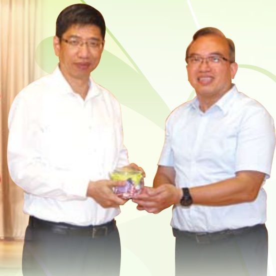
家教會主席致送禮物給校長及各同工