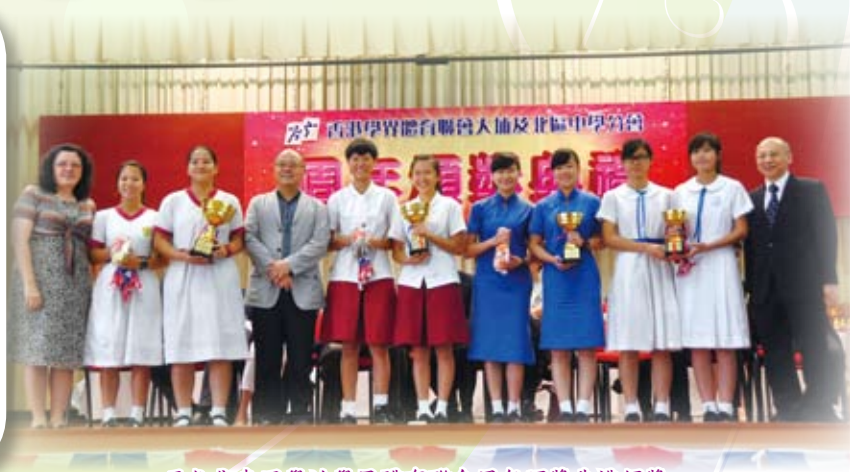
兩位代表同學於學界體育聯會周年頒獎典禮領獎。