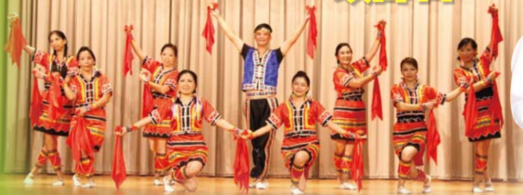
家長舞蹈組表演助慶