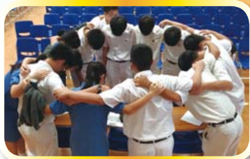
學生會ARK得知選舉結果後，一同祈禱感恩