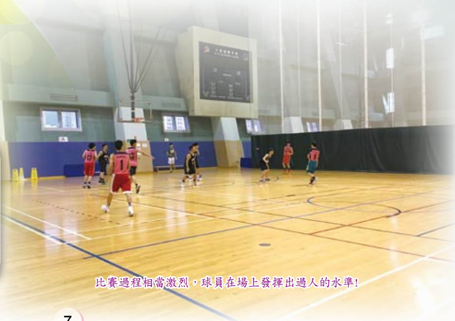
比賽過程相當激烈，球員在場上發揮出過人的水準!