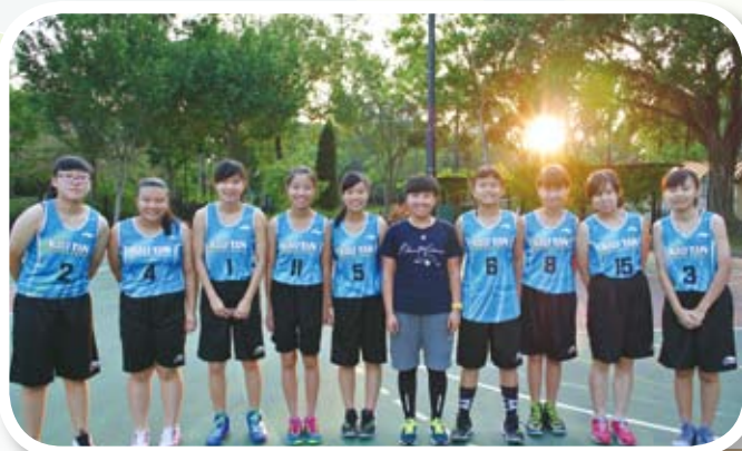
比賽前隊員們都精神抖擻！