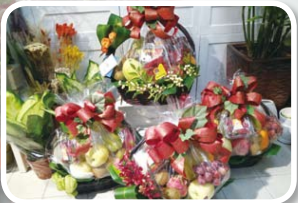
家教會致送水果給老師