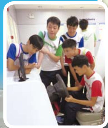
學生們投入自駕遊中

是日活動先到位於深圳的創新科技企業之一 - 比亞迪股份有限公司，參觀他們的廠房及生產線，認識到一輛車誕生的過程，了解比亞迪公司的發展歷史。學生們還可以親身嘗試駕駛私家車的樂趣。午飯過後，我們先到深圳博物館參觀，了解深圳近二十年的發展，如何由農村到工業，最後走上商業之路。學生可以在短短的參觀中，好像與深圳一同成長。最後，我們由導賞員帶領參觀深圳工業展覽館，館中展出上千件不同時代的發明或器材，令學生們目不暇給，他們更可以親身去操作不同的器材，例如：現時十分流行的虛擬現實VR (Virtual Reality)，令學生留下深刻印象。希望救恩書院的學生能夠多放眼世界，認識香港以外的人和物，增廣見聞。