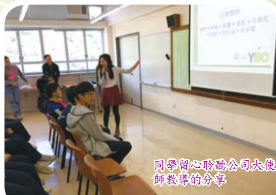
同學留心聆聽公司大使師教導的分享

本校於2016年3月至5月期間參加青年企業家發展局舉辦的「商校家長計劃」，以公司結合學校的形式，幸獲香港科技大學校友會派出公司大使到學校舉辦六次不同主題的工作坊，活動形式包括遊戲、匯報、情景處理、參觀、嘉賓講座、企業家經驗分享等，供本校25位中四同學參加。計劃協助同學建立積極和正面的企業精神思維。計劃完成後，盼望同學將能掌握社會對他們的期望，並認知到如何裝備自己，面對未來職場的挑戰。本校同學及公司大使伙伴最後獲大會頒發「最佳商校伙伴獎」，對參與的同學是莫大鼓勵。