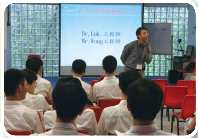
工程師學會的代表向同學介紹不同種類的工程工作前景

我們日常生活起居，無論在衣食住行各方面都是與「工程」息息相關。升學及就業輔導組與物理科邀請了「香港工程師學會」在五月二十七日舉辦了升學講座，推廣對工程的認知。兩位工程師學會的代表詳細介紹不同種類的工程工作，並介紹了成為工程師的升學途徑，出席的高中同學留心聽講，獲益良多。