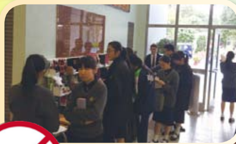
午飯時間有不少同學都駐足欣賞作品並進行投票