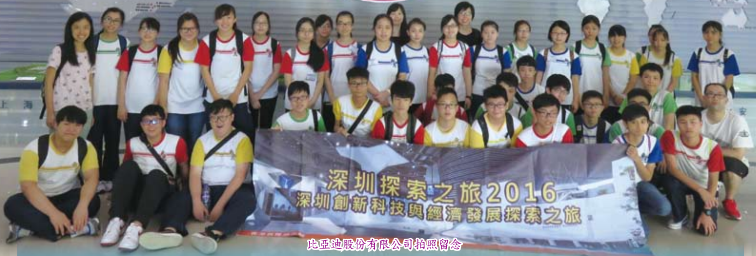
比亞迪股份有限公司拍照留念

為了增進學生課堂以外的學習經歷，本校獲教育局的資助，由生活與社會科於2016年7月7日舉辦「深圳創新科技與經濟發展探索之旅」，是次活動有四十位中二至中三學生參加。是次活動目的希望透過實地考察，讓學生進一步認識深圳的創新科技企業規模和發展，以及認識深圳的歷史和經濟發展，為高中通識教育的課程作準備。