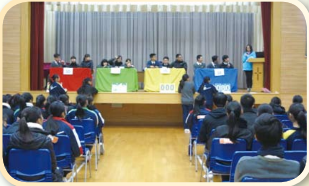
台上同學留心聆聽問題，準備按燈搶答!

中三級健康生活問答比賽以班際形式進行，4班的同學都投入支持自己的班代表。比賽過程中氣氛緊張，各班都很團結，尤其是搶答環節!!最後4班都勢均力敵，齊齊取勝。希望同學在過程中都能學習到不同方面的知識，運用於日常生活中!