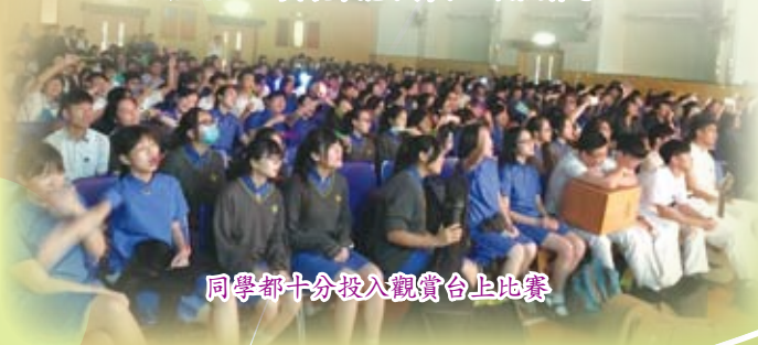
同學都十分投入觀賞台上比賽