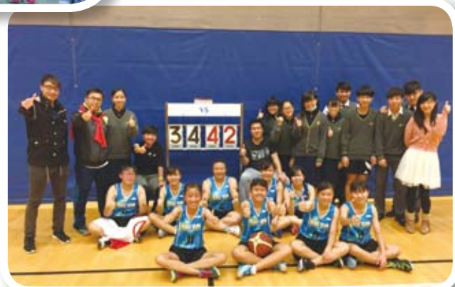
感謝各位老師及同學到場支持打氣！