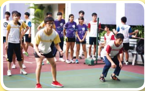
閃避球比賽非常精彩，同學們都為自己班別的隊伍吶喊助威