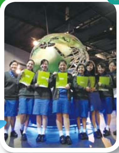
同學參觀香港航空探知館