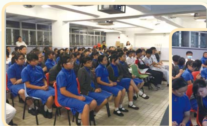
同學們在過程中都很留心觀看影片

活動希望同學了解吸毒青年的背景以及他們的過去，並藉此學習尊重及接納他們。活動中同學們觀看了相關影片，並作背景介紹，最後邀請同學們寫下心意卡送予正在戒毒的青少年，以送出我們的關心，並鼓勵他們不要放棄。