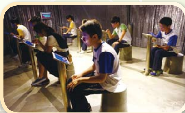
在體驗館內同學們會透過不同的任務賺取積分，同時在過程中亦會出現不同“驚喜”，讓同學們體驗人生。

生命歷情體驗館？一開始大家都不知道活動是甚麼。但原來活動可以令我們反思生命、時間的意義。活動體驗館內分為四個區域：(1)人生起步點 (2)成長的抉擇 (3)時光隧道 及(4)安息地，經歷人生旅程，於旅程結束後有解說環節，令學生重新思索何謂「年青」、何謂「年老」，從中領略時間的寶貴，學習珍惜身邊人和事，學生除了覺得好玩，對生命更有深刻的體會；人生充滿意外，時間不會為任何人留下，所以我們都要好好珍惜家人、朋友和夢想。