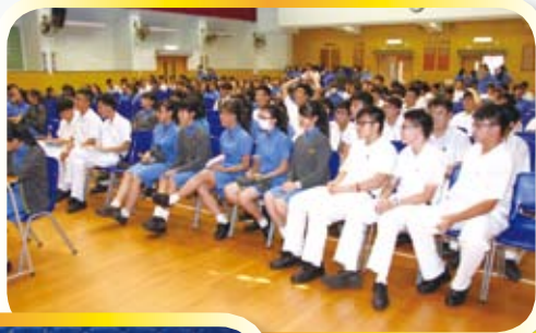
同學們在等候點票結果