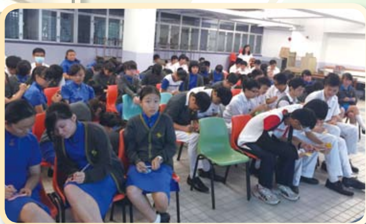
同學認真寫心意卡給更新人士