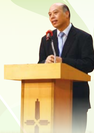
洪開基傳道信息分享