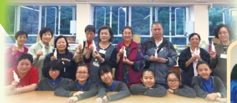
同學和長者完成製成品後大合照