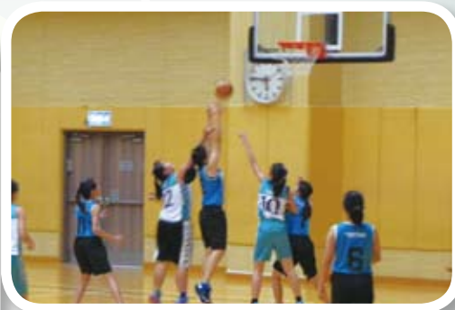
隊員們全力以赴作賽。