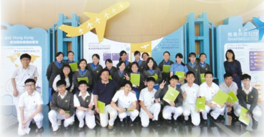
同學參觀香港國際機場並留影

為了擴闊學生視野，26位中五級的同学於2016年5月18日前往參觀香港國際機場，讓他們體驗課堂以外的學習樂趣，參觀活動內容包括介紹機場的簡報會、參觀有關機場目前及未來發展的展覽和機場設施，亦有探討機場發展對青少年就業前景的影響。