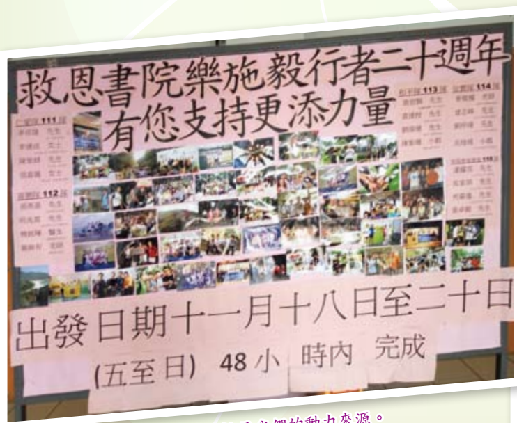
「有您支持，更添力量！」就是我們的動力來源。

各位有心繼續支持我們的家長，可以在12月20日前登入樂施毅行者網站 http://www.oxfamtrailwalker.org.hk ，於捐款欄按鍵，輸入0111 / 0112 / 0113 / 0114 / 0115 其中任何一隊「救恩書院毅行者二十周年」隊伍，又或以支票台頭「樂施會」，背面寫上英文姓名、子弟班別及聯絡電話，12月10日前交到救恩書院校務李小姐收。謹在此衷心多謝您們的支持！