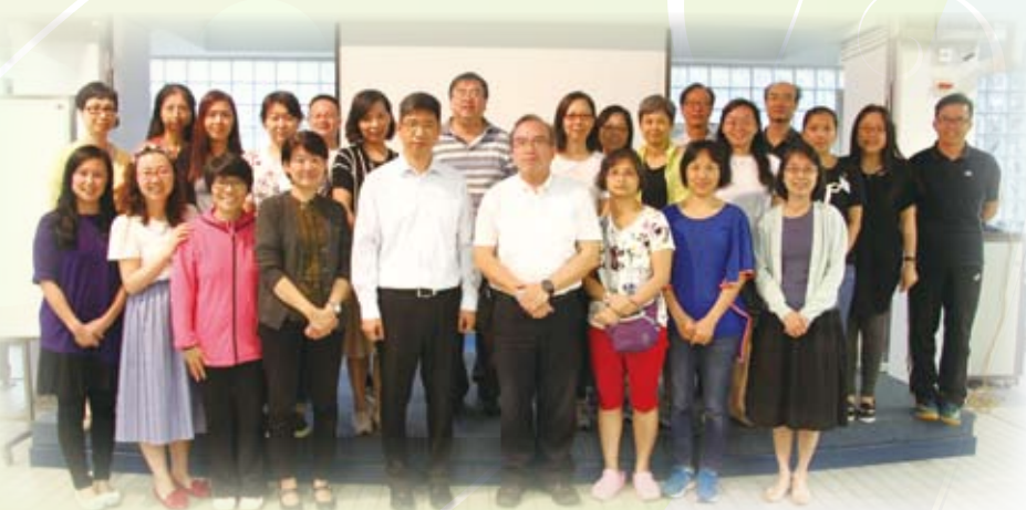
選舉結束後大合照