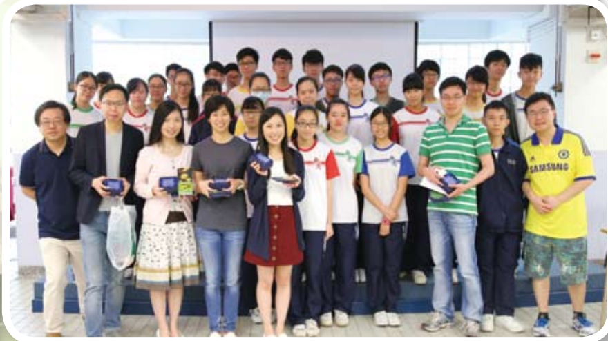
同學贈送紀念品給公司大使並合照