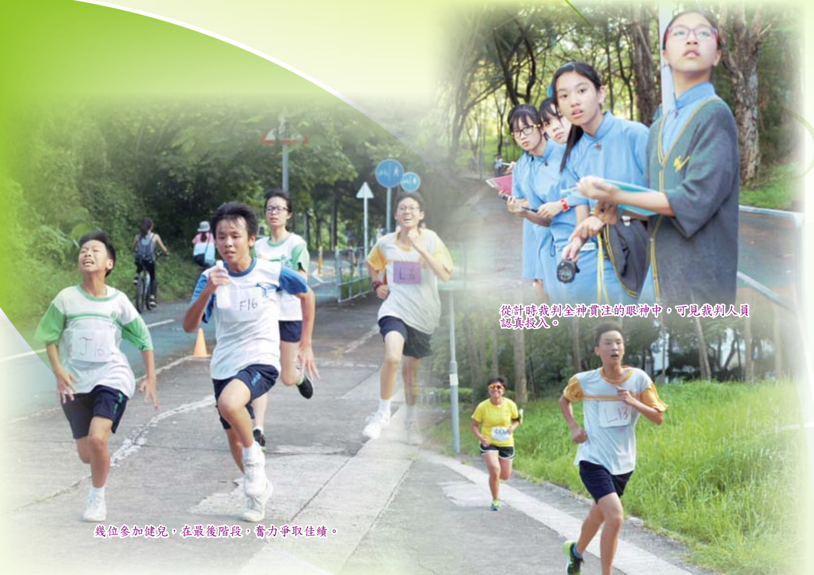
幾位參加健兒，在最後階段，奮力爭取佳績。