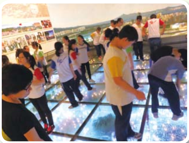
深圳歷史博物館尋找深圳所在處