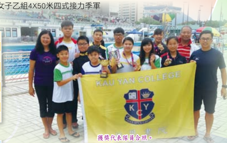
獲獎代表隊員合照。