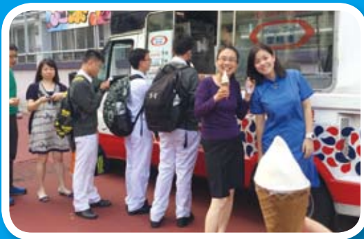
慈善救恩老香港日—雪糕車

慈善救恩老香港日由學生會主辦，當天除有雪糕車於校園內售賣雪糕、有自製懷舊麥芽糖餅攤位、有即影即有拍照服務外，亦有攤位遊戲讓同學們玩樂。同學只需捐贈$20就能夠享用雪糕／懷舊麥芽糖餅、即影即有拍照及玩攤位遊戲。最後我們為樂施會毅行者共籌得六千圓正。