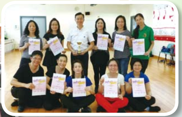
家長舞蹈組熱心參與社區活動