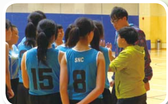
比賽期間與隊員們一起商討策略。