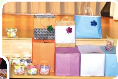
家長們準備精美禮物送給各同工