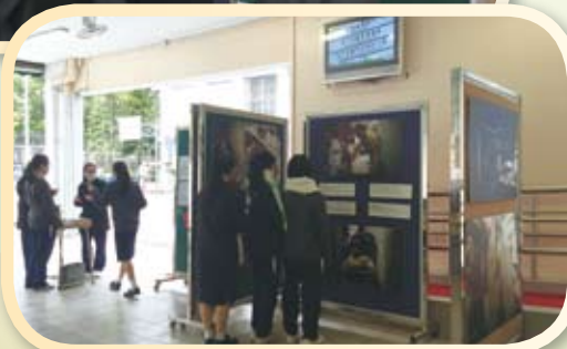
展覽於雨天操場進行，午飯及放學時間都會有學生駐足欣賞展覽。