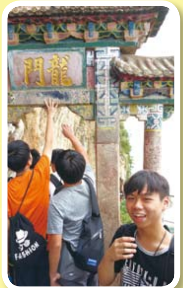
一登龍門升價十倍。看！同學們經過龍門石窟時，均表現得非常興奮。