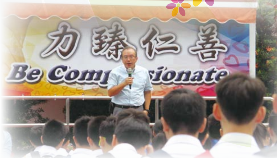
家教會主席於敬師日早會分享