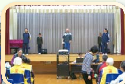
同學們與長者一起到台上表演排排舞，表現超卓，十分精彩，觀眾都十分欣賞。