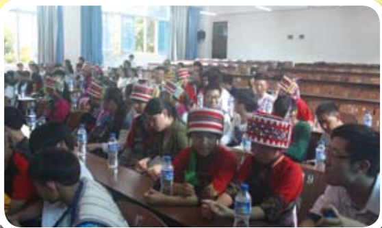
與石林縣第一中學學生交流情況