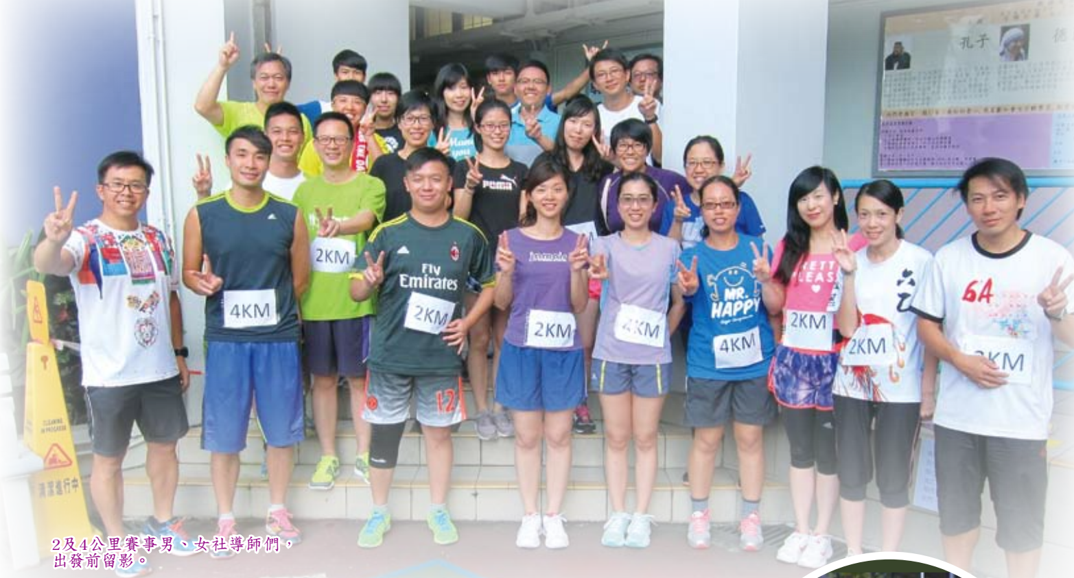
2及4公里賽事男、女社導師們，出發前留影。