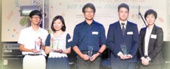
公司大使合照出席商校最佳夥伴頒獎典禮