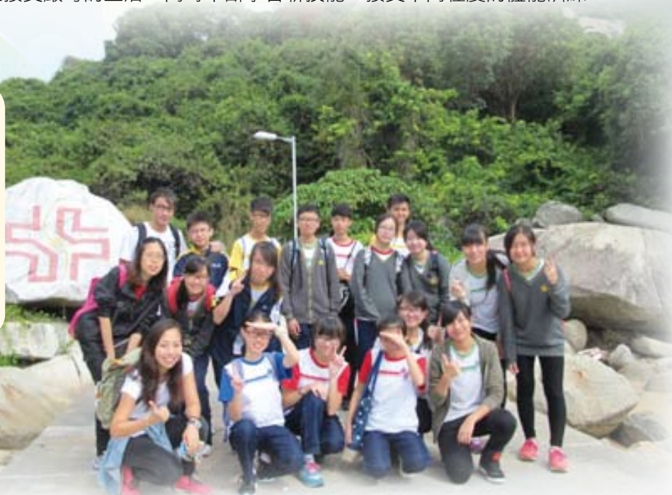
參觀的同學在正生書院留影