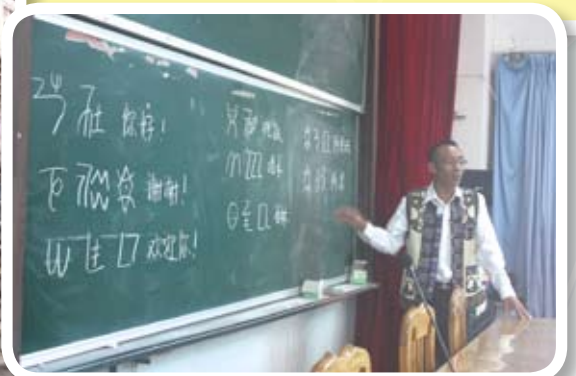
雲南縣第一中學老師教授同學學習彝文