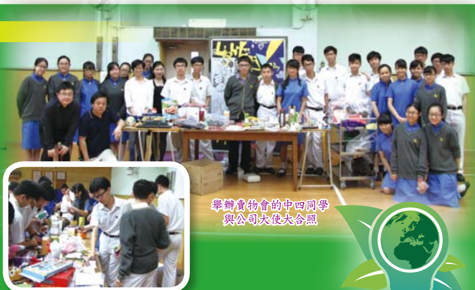
舉辦賣物會的中四同學 與公司大使大合照

為配合「商校家長計劃」，二十多位中四同學於5月 17-19日舉辦慈善環保賣物會，同學收集二手舊物出售，所籌得款項全數捐「無國界醫生」，既環保，亦有公益意義。籌備的、捐贈物品的、購買物品的，他們的付出都是不可少的。當日老師同學們積極參與，甚至購得心儀物品的同學們臉上展露笑容，氣氛熱鬧。師生每人付出一點，便成就了這個為「無國界醫生」籌款的慈善活動，共籌得善款為6720元。眾志成城為公益，多麼美麗的一幅圖畫！