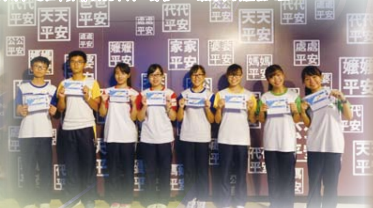
拿著我們的人生登機証，準備進入體驗館，開展人生旅程!