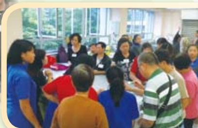
長者和同學都很留心聽從導師的指導