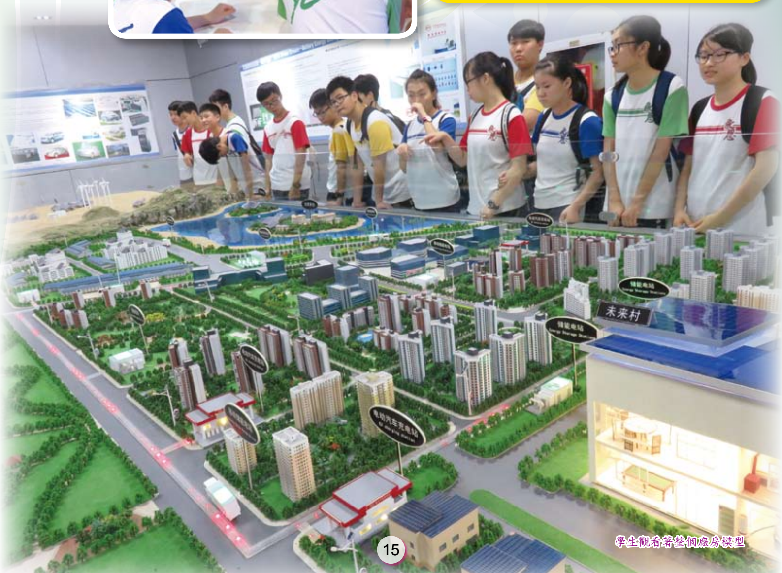
學生觀看著整個廠房模型