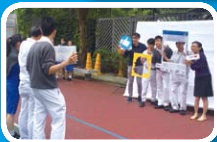
慈善救恩老香港日—即影即有拍照區