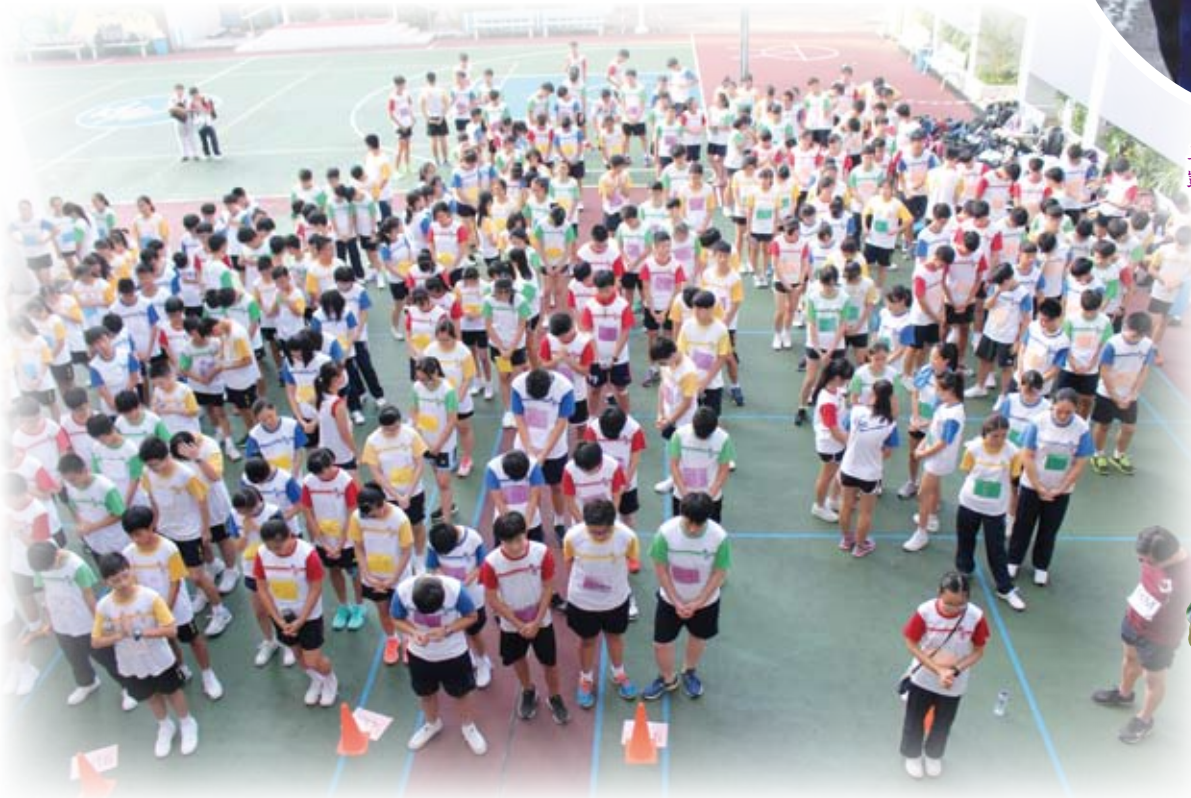
出發前，各老師及健兒先祈禱，讓各參加者全程的平安，都交在主手裡。