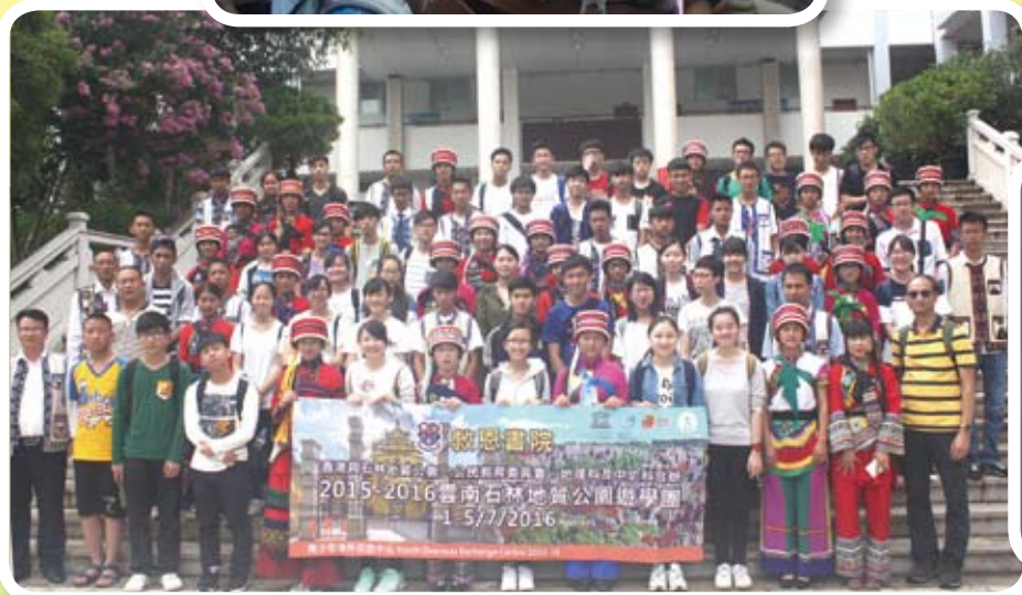
與石林縣第一中學交流合照