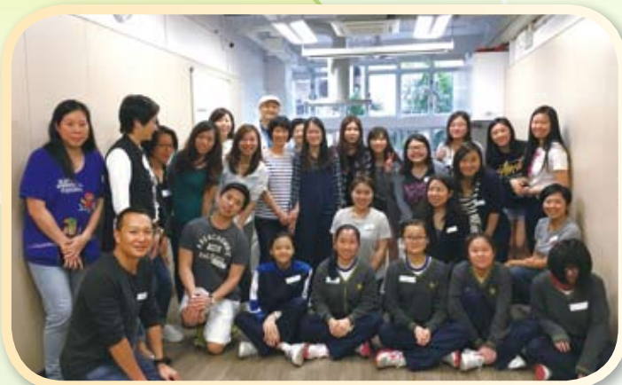
同學們參與外間機構的活動，一起到長者中心為長者進行溫燙服務!

全賴同學熱心投入，長者們在活動過程中都很開心，更對同學評價甚高。大家都很欣賞同學的投入和付出!!!