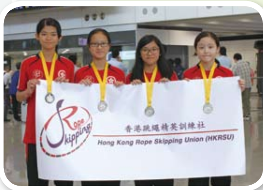
中國香港跳繩代表隊凱旋回歸