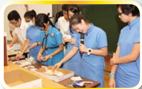
代表會幹事進行點票工作