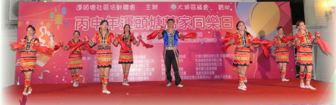
9月24日於運頭塘邨社區演出