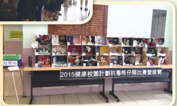
同學們用心製作的格仔箱整齊排列，準備給全校同學欣賞投票。