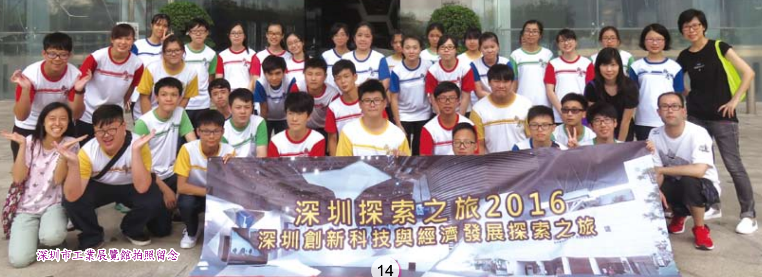
深圳市工業展覽館拍照留念