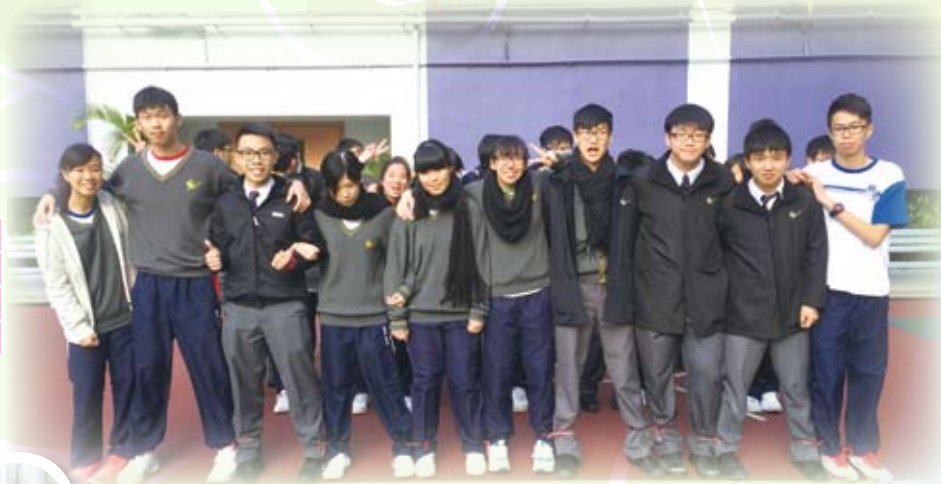
同學們無懼跌倒，齊心協力勇往直前，值得鼓勵