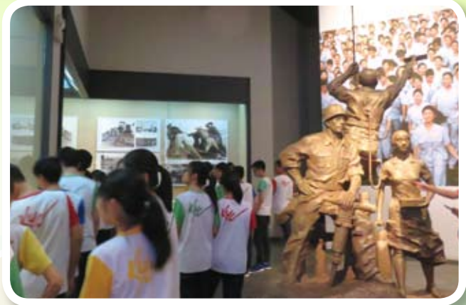
深圳歷史博物館表現深圳居民勤奮