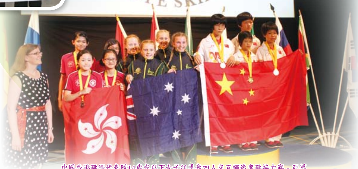
中國香港跳繩代表隊14歲或以下女子組勇奪四人交互繩速度跳接力賽 - 亞軍