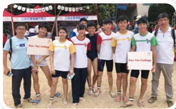
公益金會德豐百萬泳2016，我校派出兩隊隊員，為公益金籌得 $ 5萬元善款。