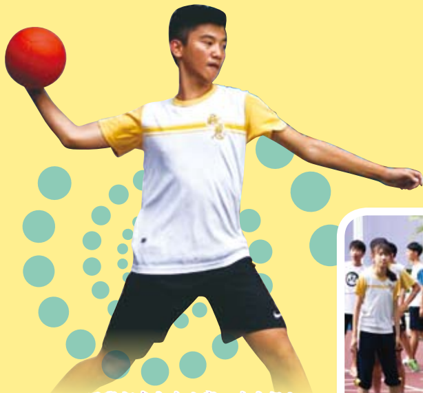
同學都盡全力比賽，十分投入

學生會Sincere於2015-2016年度，舉辦了不同的活動，讓我們重溫部份的精彩片段！