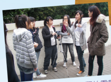
同學在演藝學院校園實習拍電影

本校中四視藝班參加由香港演藝學院表演藝術教育中心舉辦，滙豐銀行慈善基金贊助之「smARTS演藝之旅」計劃 (Stimulating Minds through ARTS)。全班出席演藝學院安排之「smARTS演藝之旅」之電影電視活動一：寫意快拍錄像短片製作坊，並於三個月內完成迷你電影的拍攝，再由導師跟同學分析創作的優劣，實在獲益良多！