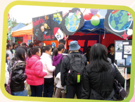
一齊來欣賞我們的攤位