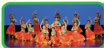
十五位美麗活潑的印度少女，勇奪大埔區第29屆校際舞蹈比賽金獎及最佳服裝獎，並第44屆學校舞蹈節優等獎。