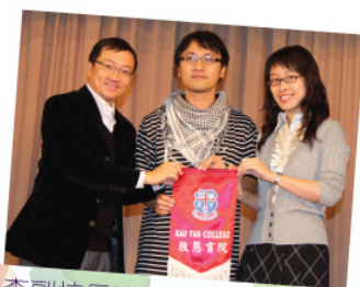
李副校長致送紀念旗給嘉賓導師