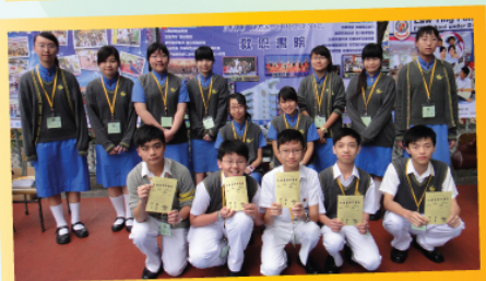
參展攤位及校園大使