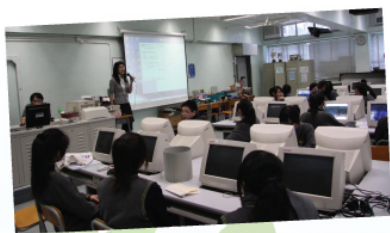
視藝科同學在電腦室學習形體動畫的製作技巧

本校視覺藝術科安排中四級同學參加由香港藝術中心與香港美感教育機構合辦之「形體動畫工作坊」，於2009年11月16日先在禮堂欣賞30分鐘的動畫。下午選修視藝科的26位同學在電腦室學習形體動畫的製作技巧，並即時製作一套5分鐘的動畫。