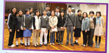
部份得獎同學與老師在茶會合照，一起分享得獎的喜悅