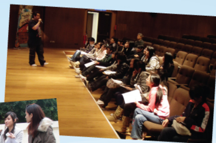
中四同學正出席演藝學院安排之寫意快拍錄像短片製作坊