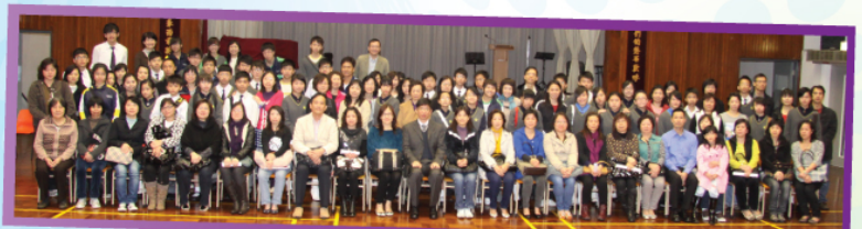
齊齊來張大合照，恭賀獲進步獎的同學

最令我感動的是一位家長的分享，她如何鼓勵女兒不怕失敗，鼓起勇氣面對困難，並有計劃地讀書，按部就班就一定會成功。在母親不斷鼓勵下，同學果然不負所望，成績大有進步，最終獲得到最佳進步獎。