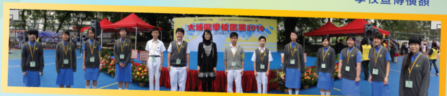
【大埔區學校匯展】現場