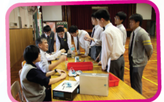
燃料電池模型吸引了大批同學觀賞。