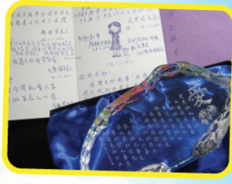
組員在小組重聚日時向歐陽老師表達謝意