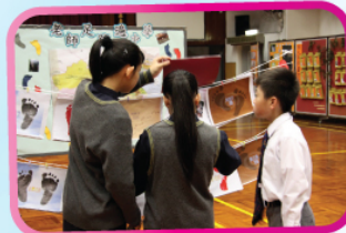
「老師足跡遍中華」同學細心欣賞老師旅遊的照片，並了解中國省的風土人情