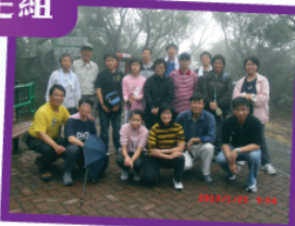
黎達強老師、周校長與家長於大小刀刀留影