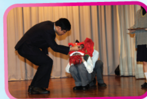
周校長點睛為學術周揭開序幕

各科展板的主题對中國現代藝術家、中國人口分佈、中國運動發展以至中國科技開發等課題都有深入淺出的介紹。同學細心欣賞負責老師及同學的精心傑作，並踴躍參與綜合問答遊戲換領精美的獎品。在云云眾多展板中，最吸引同學駐足欣賞的可算是中史科以《老師足跡》為題的展板了。