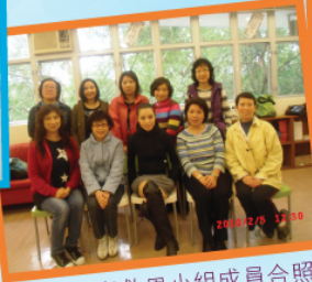
老師與救恩小組成員合照