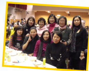
家長們盛裝出席，多漂亮