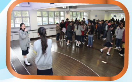
【綜合藝術室】二重唱表演