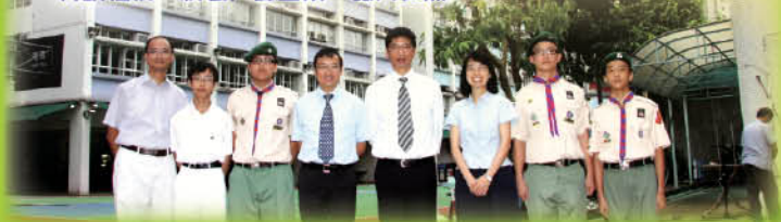
升旗禮後，校長、師生來一張大合照。

2009年10月1日，乃是我國六十周年國慶的大日子，公民教育委員會及中史科為慶祝國慶六十周年盛事和為增加同學對中國國情的了解，便以「愛我中華賀國慶」為題，在9月29-30日於本校禮堂舉辦了別開生面的攤位活動。四個攤位包括「國情知識大比拼」、「中國知多少」等，期望透過遊戲及問答形式，以求增加同學對中國的了解及關心。