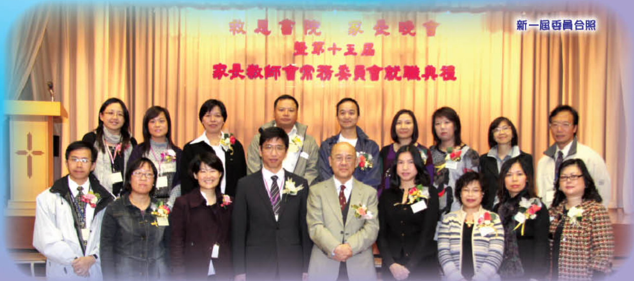
救恩書院 家長晚會 暨第十五屆 家長教師會常務委員會就職典禮

最後，感謝上一屆的家教會各位委員。因著你們無私的付出和努力，讓本會去年舉辦的各項活動，能夠順利完成。我再一次衷心向你們這班可愛的天使說聲多謝，也祝福你們身體健康，主恩常在。