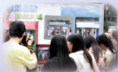
「拼貼大埔」作品吸引了很多途人駐足觀看