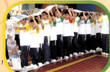
羣策羣力，齊心就事成！