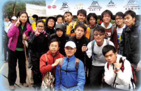
16位隊員出發前留影及誓師