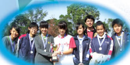
女子乙組榮獲優異獎

本校長跑隊於2009年11月20日參與本年度大埔及北區學界越野賽。各運動員亦悉力以赴，最後女子組更取得優異成績。