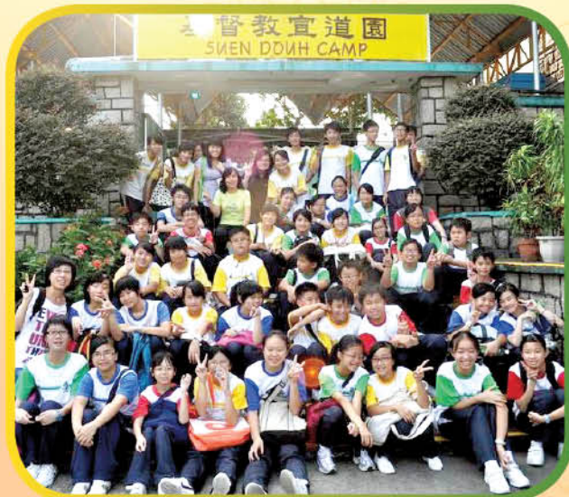
再見宣道園！祝願大家友誼長存。

新一屆學兄學姊於十月十七日在粉嶺基督教宣道園與學弟學妹共聚，渡過了快樂的一天。活動當天，學兄學姊組織了很多不同類型的活動與學弟學妹一同參予，解難、令相方感情增進不少，展望來年大家共証救恩的關愛文化。