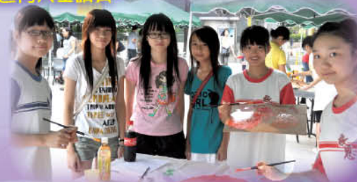
同學即場就豐盛人生為題創作