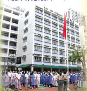
國慶六十周年盛事全校一起參與升旗儀式

「愛我中華賀國慶」活動最終完滿結束，除了感謝同學們熱烈參與外，亦鼓勵同學不單只是在是次的活動中接觸中國國情，於平日也可多留意祖國所發生的大事，畢竟中國與香港是息息相關的。