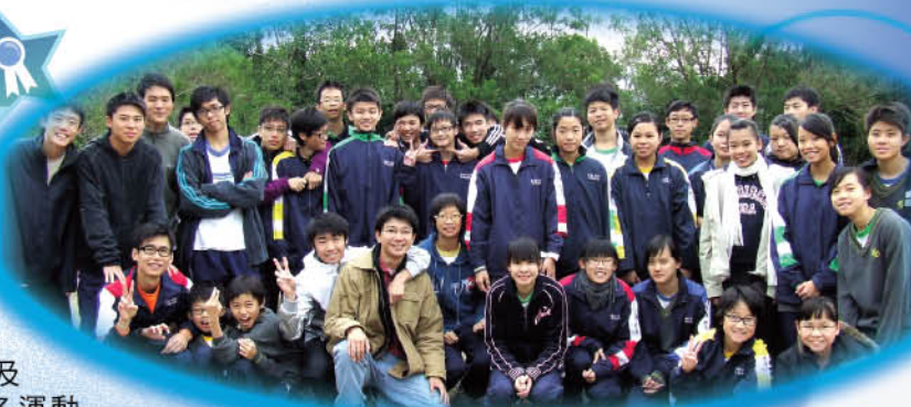
09-10年度越野賽全體隊員

本校長跑隊於2009年11月20日參與本年度大埔及北區學界越野賽。各運動員亦悉力以赴，最後女子組更取得優異成績。