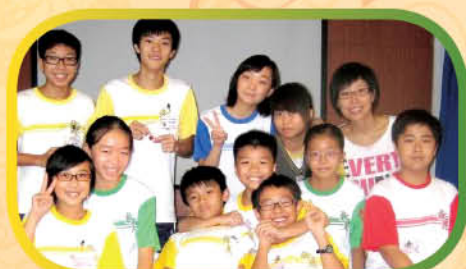
學兄學姊及學弟學妹樂在營中