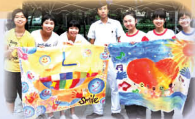
同學完成作品後，與作品合照

10月25日中三級同學參加了由「銘恩中心」舉辦「潮流藝墟之畫出豐盛人生」活動。當天活動由早上十一時開始至下午五時正，參加同學除協助將學生作品展示，讓大埔區居民觀賞外，更於席間聽了由香港教育學院藝術系副系主任黎明海博士的分享及交流美術創作的經驗，令同學獲益良多，最後同學更即場以豐盛人生為題創作掛畫，效果理想，而同學所展示的作品「拼貼大埔」亦深得區內人士讚賞。