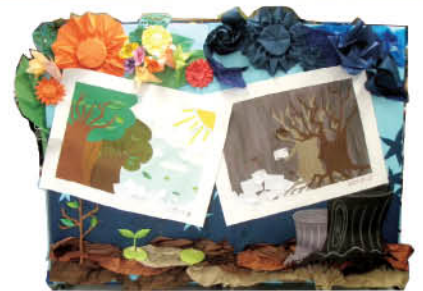
第一屆校際《植林造紙》壁報設計比賽得獎作品