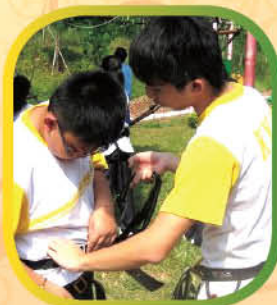
學兄在細心地指導學弟扣上安全扣