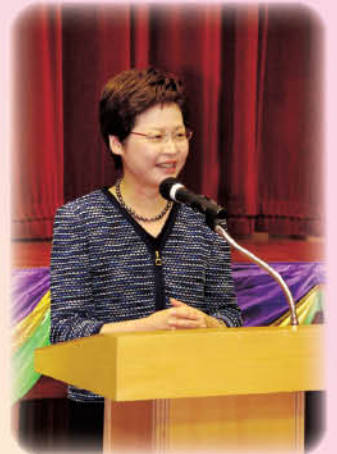
林局長致辭，勉勵學生抗逆能力

是啊！盼望下次再見之時，大家彼此見證：就像先賢一樣，勇敢地展開尋夢之旅，無懼逆境，活出豐盛人生。