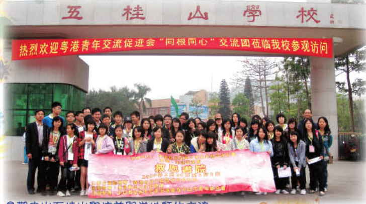
參觀中山五桂山學校並與當地師生交流