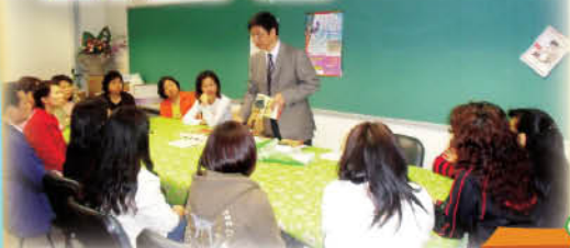
家長積極參與，分享讀書心得