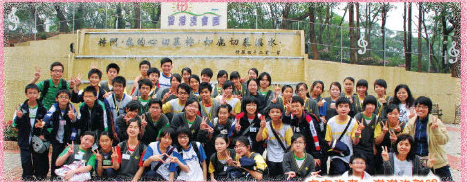
空空的來，滿滿的離開