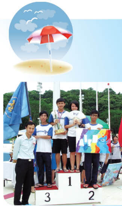
信實社連續四屆獲得全場冠軍，可喜可賀。