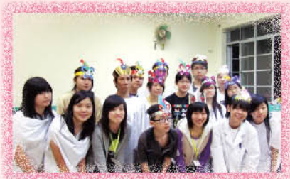
在「人生」完結時，他們因選擇上帝而可以上天堂

今年復活節營會已於四月八日至十日在烏溪沙青年新村順利完成。今次營會的主題為「命運自選台」，有70個同學參加，其中有7個同學決志接受耶穌基督為救主，感謝神！以下是三位同學參加後的感想：