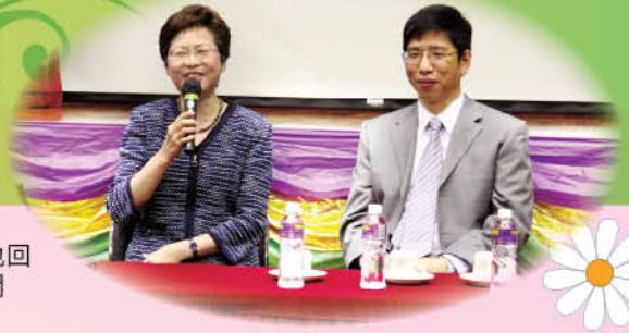
林局長親切地回應學生的發問