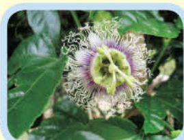
可觀自然教育中心種植的熱情果樹開花了