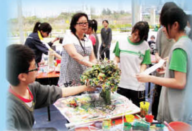
藝術家正在指導同學創作的技巧

最後，要多謝大會安排免費的旅遊巴士和贈送參與學生每人一本雕塑書籍，對於藝術家的分享指導和工作人員的協助，實在是感激，當中學生和老師確是享受這次的學習活動！