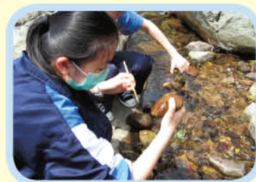
學生正在仔細地尋找石頭上的生物