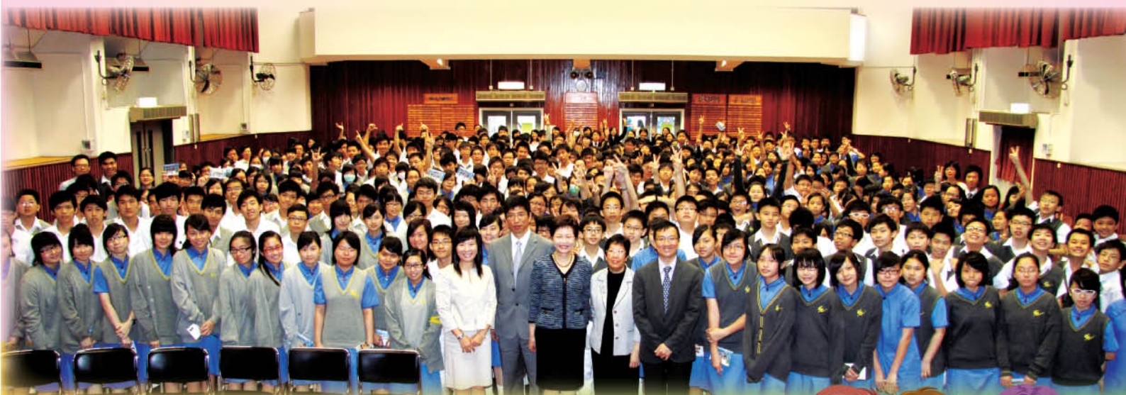
樂也融融的大合照