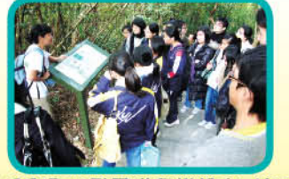
同學專心聆聽導師講解南丫島的環境訊息