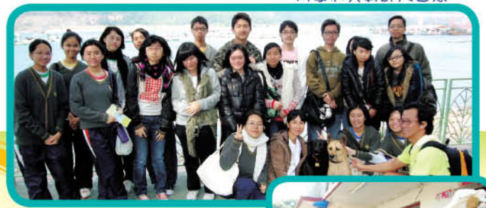
同學們與導師大合照

總括而言，我們親切地體驗祖國在不同方面的變化，更增進對祖國的認識，相信對我們將來安身立命有所裨益。現在中國在國際上的地位越來越重要，我們一定要爭取機會認識祖國的最新動向。