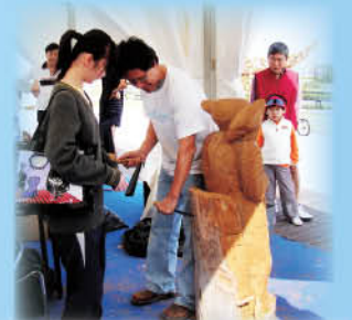
駐場藝術家親自教授雕塑技巧