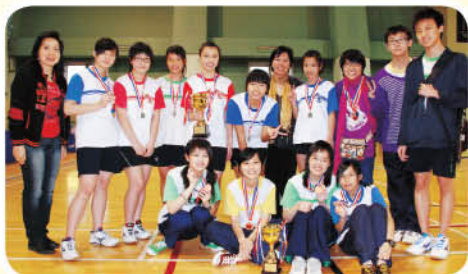
女子甲組及女子丙組隊員