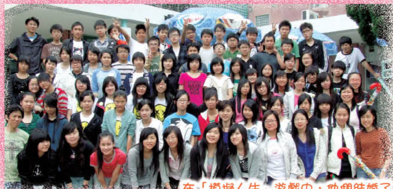
在「模擬人生」遊戲中，他們結婚了