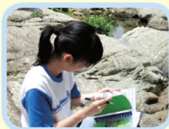
學生正在辨認生物的類別