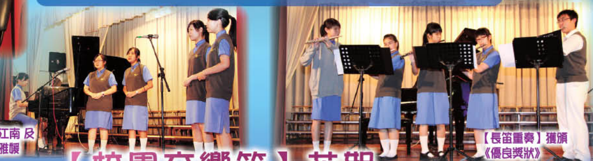
【長笛重奏】獲頒 《優良獎狀》