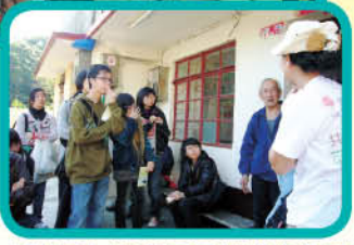
探訪南丫島居民講述海龜產卵

經過這次活動，我不但能夠學習到許多關於大自然的知識，更得到不少收穫：包括老婆婆親自上山採摘的鮮甜楊桃，在附近購買的手信……總的來說，是很快樂的旅程。