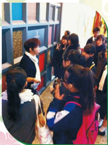
導賞員向學生講解設計師常用布料的特質

模特兒的照片和資料，學生可欣賞到香港時裝發展的多元文化、出色的設計和成就，其後，更透過互相闡述對作品的評賞，詮釋出作品的不同面貌，極富啟發性。