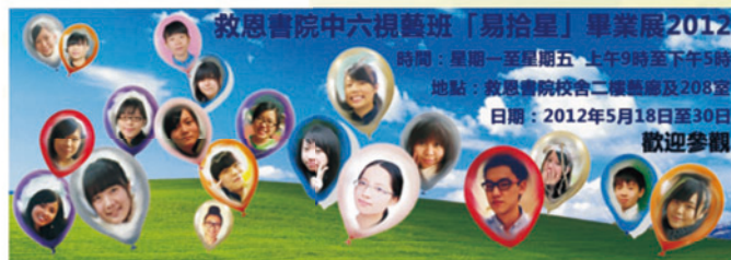
易拾星畢業展邀請卡背面