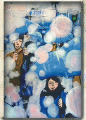
中學組優異獎 6B 朱其真