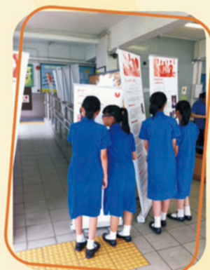
VAM 視藝小記者培訓計劃學生藝評作品於本校展出的情況