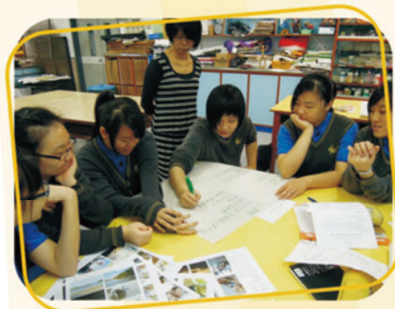
「綠活計劃」的上課情況，學生專注地作小組討論