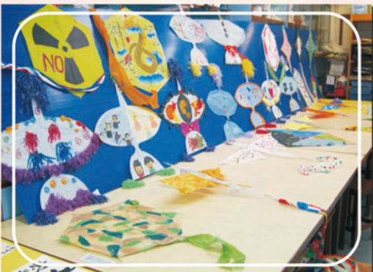
分享會期間的作品展