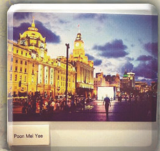
攝影比賽優異獎 6B 潘美義