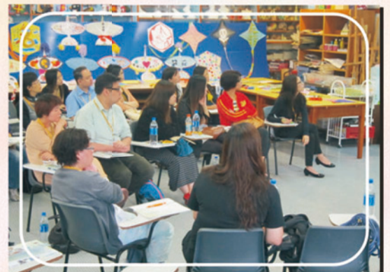
同工們專心聽嘉賓分享