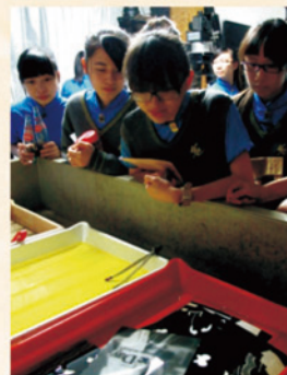
學生在黑房中細看自己努力的成果

2011年11月份，鄭映霞老師帶領中五級視藝班同學參加由香港攝影藝術家尹子聰先生舉辦的黑房攝影工作坊。工作坊內容包括攝影藝術家到校講解攝影歷史、黑房沖曬原理、針孔攝影及藝術家創作的心路歷程等，而最精彩的莫過於到尹子聰先生位於上環的工作室，實地作四小時的創作。雖然學生的作品有成功亦有失敗，但過程中令他們對攝影有另一番體會及認識；相片已不只是一張供大家欣賞的平面作品，而是一張包含了許多故事和心思，需要多番細味的藝術品。