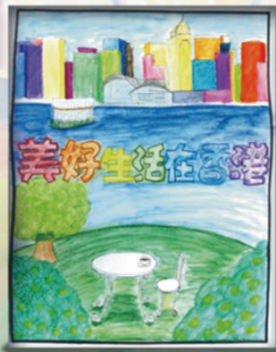
中學組冠軍 5D 劉漫蔚