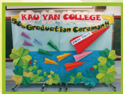
畢業班同學更設計及製作畢業禮壁報，讓同學和家長拍照留念。