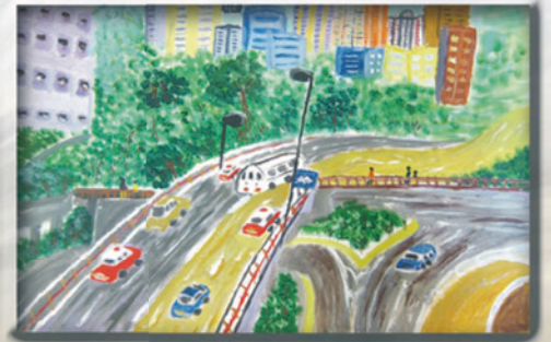
中學組季軍 6D 李詠儀