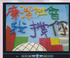
動畫創作比賽得獎作品 4E 鄭子琳 4D 陸蒼瀾 4F 何恩祈