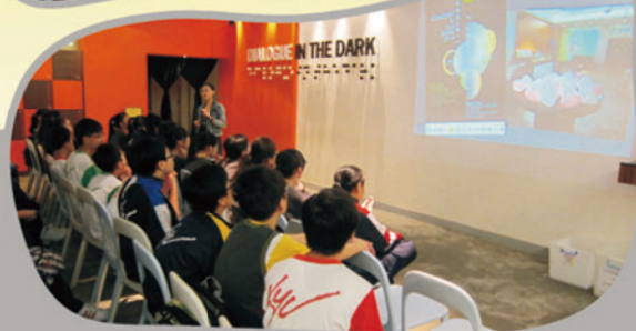
同學留心聆聽導師對黑暗中的對話這機構的介紹