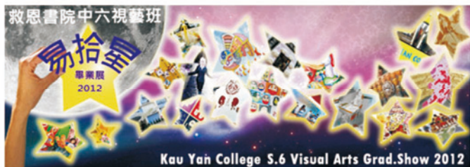
易拾星畢業展邀請卡正面