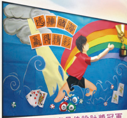
壁報設計比賽最佳設計獎冠軍 5D 劉漫蔚 5E 張愷彤