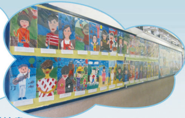
中一級全級繪畫 「我是誰」 作品展

為提升同學的成就感和重視個人的創作成果，本年度視藝科於初中級首度推行全級作品展，由於全級同學的每件作品皆可展出，同學對個人的創作效果均非常重視，再三修改至最好才繳交展出，效果相當理想。