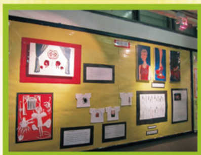
畫廊一角，開了射燈的效果