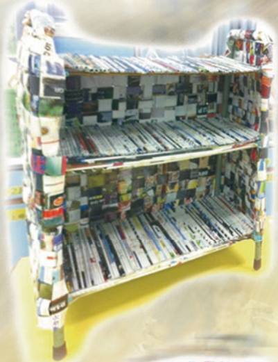
小型傢俬組季軍 5D 劉漫蔚 5E 張愷彤 5D 馮煒晴 5E 何雅穎