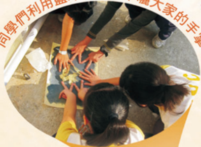
同學們利用藍印在陽光下曬大家的手掌