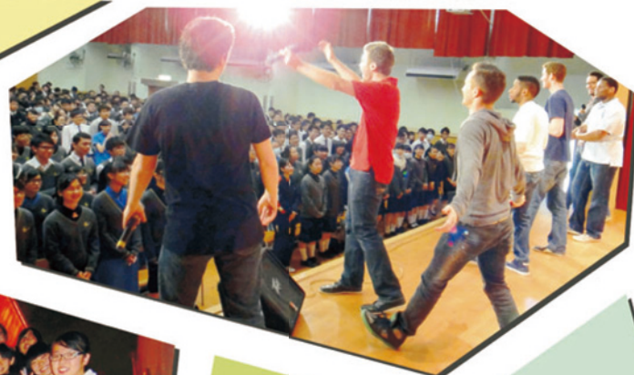
Yellow Jacket & Friends 校園工作坊