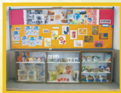
60周年校慶紀念品設計