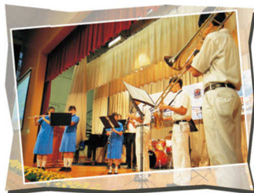
西樂團於畢業禮表演