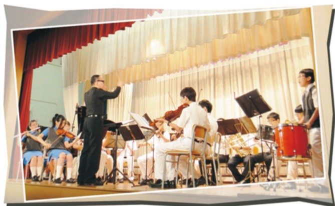
西樂團於音樂飄飄表演