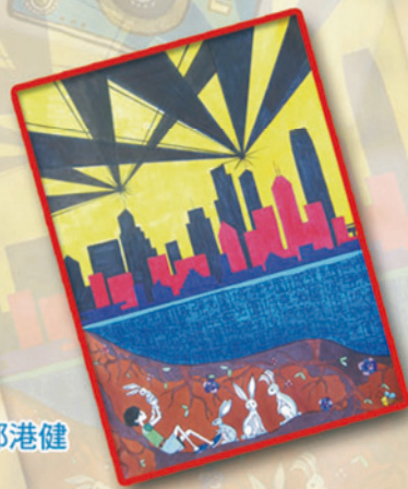
冠軍 6D 鄔港健