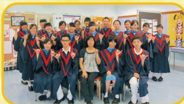
中六畢業班跟簡太合照