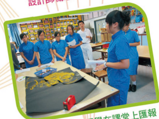
2012年，中六同學在課堂上匯報個人創作，然後自評和同儕互評